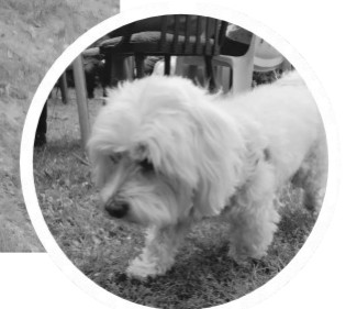
és a szék alatt...