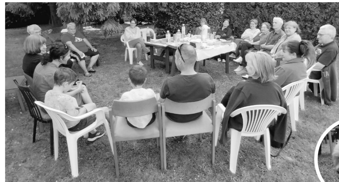
Pünkösöd hétfői gyülekezeti délutánunk résztvevői a szék felett...