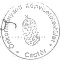
Péntek Gabriella Polgármester