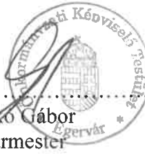
Gyerkó Gábor Polgármester